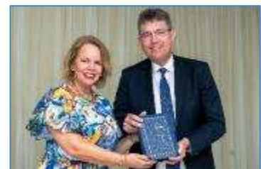
Foto: Evelyn Wever-Croes, premier van Aruba, krijgt de Papiamentto-Bijbel overhandigd door NBG-directeur Buitenwerf. (Foto NBG).

Bronnen: UBS / Nederlands-Vlaams Bijbelgenootschap